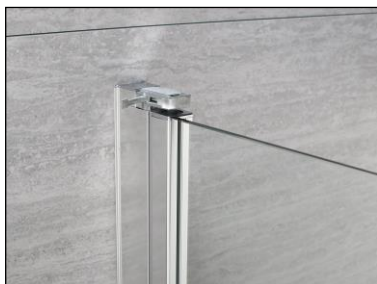
Vision 2.0 klips åpen