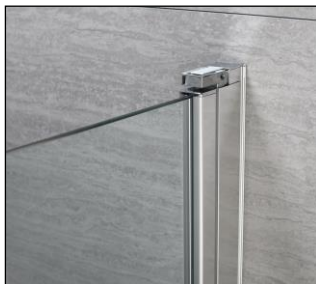
Vision 2.0 klips lukket